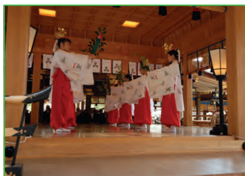
倭舞 (Yamato Dance)