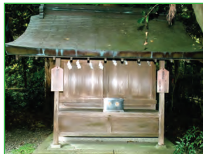
聖神社・三宮神社