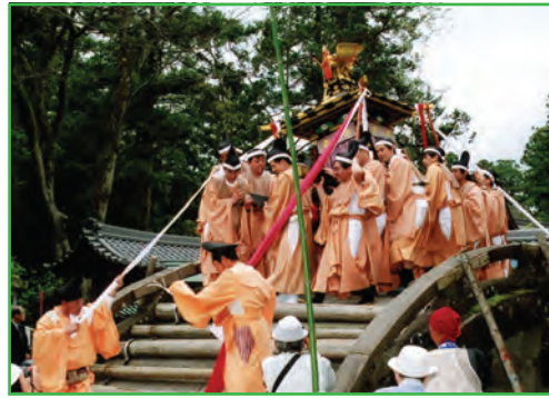
鳳輦 (Houren Imperial Carriage)

The Toga Festival, held every year on April 22, boasts a history going back to the Kamakura period, and is Toga Grand Shrine's biggest festival. People to be in charge of the festival, called batoujin , are elected annually from the old Inukami district (present-day Inukami County and Hikone City). The decided batoujin , who have taken their official vows before the gods in the Sashisadame Ceremony on January 3, lead all the rites. First there is an austere service, the Honden Ceremony, followed by a procession with, in pride of place, mikoshi palanquins, houren carriages, and 40 riding horses, to Totonomiya Shrine, an okumiya (inner/hidden) shrine of Toga Grand Shrine, about 4 km to the east. After festivities at Totonomiya, the procession joins up in front of the Grand Shrine with the batoujin , dignitaries, and others, to form a procession called the Procession of a Hundred-Thousand Koku Lords, which then proceeds to Uchigome-no-Banba in Amago in the town. There the Tomi-no-Kiwatashi rite is performed, whereupon the procession returns to the Grand Shrine, the returning called hon-watari . Upon arrival at the shrine, the Yuhi-no-shinji (setting sun ritual) is performed, and the festival concludes.