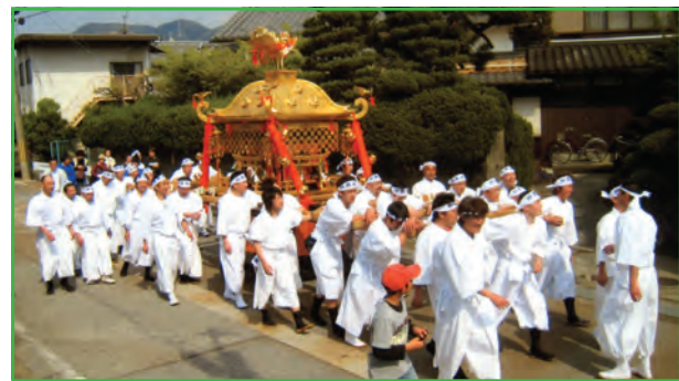
神輿 (Mikoshi Portable Shrine)