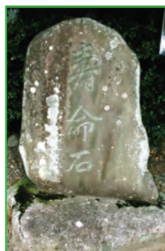
寿命石 (Life-Span Stones)