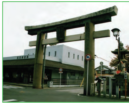
大鳥居 (Great Tori-i Gate)

多賀大社の正面にある大鳥居は高さ8.2m、様式は明神型で、昭和4年に建立されたものである。多賀大社には他に2つの大鳥居がある。1つは多賀大社から西へ4 kmほど離れた中山道の高宮にある「一の鳥居」(11m)である。寛永(1624-44)年間の建立で、大鳥居の前には神社まで参拝できない旅人のため他に例のない「多賀賽銭箱」が設けてある。もう1つは近江鉄道「多賀大社前駅」にある大鳥居で、高さは10.6mである。