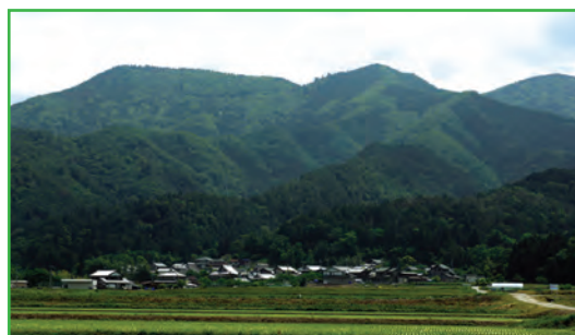
栗栖 (Kurusu Village)

When the enshrined deity Izanagi-no-O-kami descended from Takamaga-hara, and rested at a pass about 7.5 km from Taga Grand Shrine, an old man came by and offered him a meal of millet. Having finished the meal, The Great Deity Izanagi pushed the chopsticks he used into the ground, whereupon they became the roots of the cedar, and a great tree sprung up in the blink of an eye. The 3-Trunk Cedar at Sugisaka Pass is said to be that very tree. Afterwards, Izanagi stayed a while at Kurusu Village at the foot of the mountain, and opened up the land of Taga below the Serigawa river. Totonomiya Shrine was built at Kurusu. In the Korei Grand Festival, Totonomiya Shrine is the resting site of the palanquin borne from and back to Taga Grand Shrine.