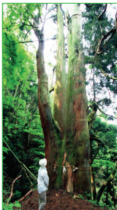
御神木 (Venerated Tree)