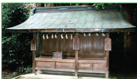
熊野新宮・天神神社・熊野神社