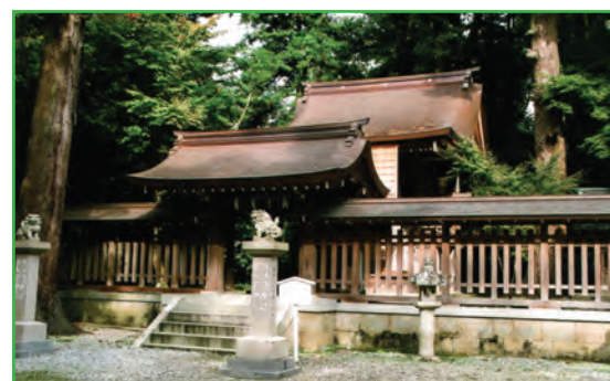
日向神社 (Hyuga Shrine)

多賀大社の西の鳥居より入った境内の西端に第一の摂社日向神社がある。本社と共に延喜式内社 えんぎしきないしゃ でご祭神は高天ヶ原 たかまがはら から日向国 ひゅうがのくに の高千穂 たかちほ に降臨 こうりん された「天孫降臨神話 てんそんこうりん 」の主人公 ににぎのみこと の瓊々杵命である。