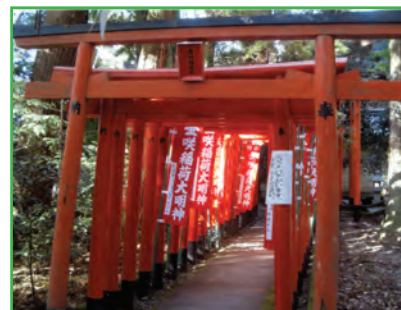
赤い鳥居 (Red Torii)

北参道沿いにある赤い鳥居と赤いのぼり旗が見えるのが金咲稲荷神社である。商売繁盛の神様として多くの参拝がある。その他安産や子育ての神様を祀る子安神社、熊野神社、神明両宮などもある。このように多賀大社の境内には摂社日向神社、末社14社があり、いろんな神様のご利益をいただくために巡拝する人々も多い。