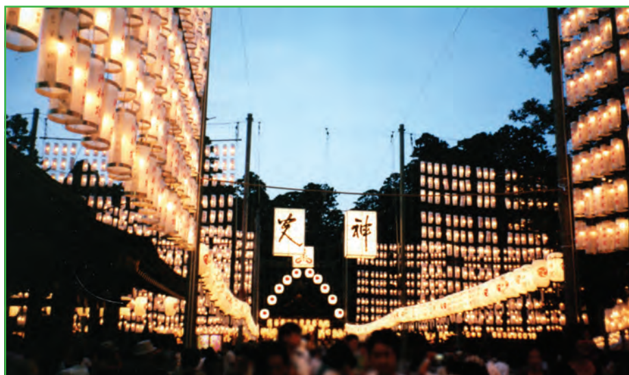
万灯祭 (Lantern Festival)

御祭神の女神 めがみ で黄泉 よみ の国を司る伊邪那美大神 それいしゆ に祖霊 そり 守護への感謝の献灯を捧げるお祭り ご で、8月3日から3日間行われる。3日の夕刻、多賀の大神様が御降臨になったと伝えられている杉坂山の御神木 もと の下で、古式により きよび 浄火がきり出される。その火が本社に運ばれてくると、境内に掲げられた万余 ちよう の提灯が一斉に明かりが灯る。舞台では、3日にわたって、神楽、猿楽、郷土芸能などが奉納され夕涼みを兼ねた多くの参拝者で賑わう。