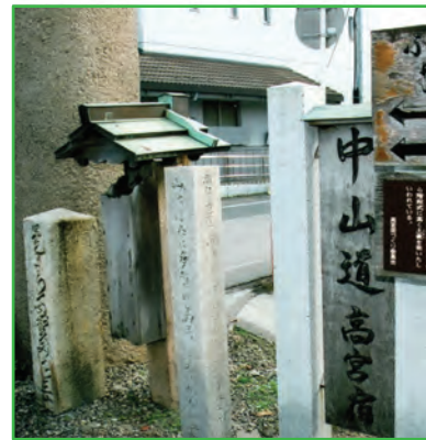
多賀賽銭箱 (Donation Box)

The Great Tori-i Gate at the entrance to Taga Grand Shrine is 8.2 meters high, and was erected in Showa 4 (1929) in the myoujin style (identified by the upward curving ends of the top lintel). There are two other large tori-i connected with the shrine; one, the 11 meters high Ichi-no-Tori-i , on the Nakasendo at Takamiya about 4 km away, erected in the Kan'ei period (1624-44), with a donation box for donations from pilgrims unable to come all the way to the Grand Shrine; the other, a 10.6 meter high tori-i at Ohmi Railway Taga Grand Shrine Station.