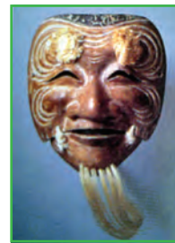
能面・狂言面 (Noh Masks, Kyogen Masks)

15世紀の多賀地域には せあみ 世阿弥の さるがくだんぎ 「申楽談義」に記されているように みまじ 敏満寺(北坂)座があったとされており、文正2年(1467)頃には多賀大社において当座が 猿楽 猿楽を勤めていたことが知られている。これらの面は おもて 室町時代以降多賀大社において盛んに能・狂言が行われていたことを示すとともに、 近江猿楽 近江猿楽の地における貴重な資料群である。