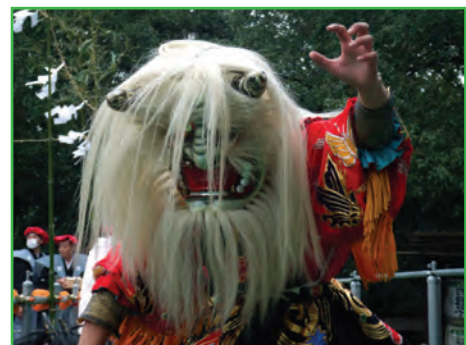
鬼の舞 (Ogre Dance)

Annually on the day of Setsubun (the day before the beginning of lunar calendar spring) in this religious festival, 300 people selected from within the prefecture and other places, as well as ceremonially garbed men and women marking their 60 th birthdays, toss lucky beans and mochi rice balls from the stage in front of the Noh-buden. The Ogre Dance, originally from Shimane Prefecture is performed, and the area is thronged with visitors hoping to catch some good fortune.