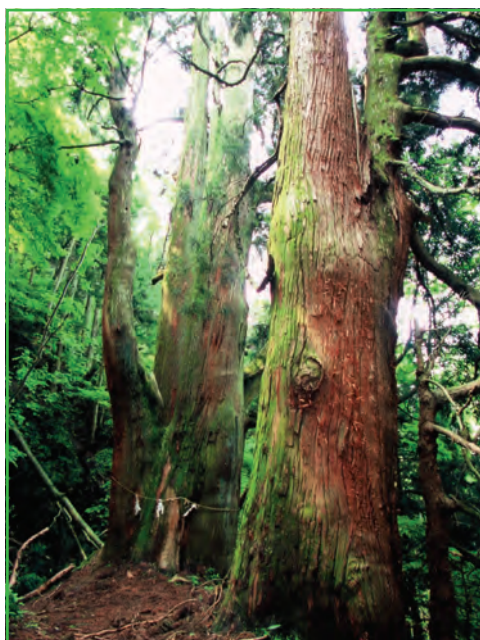
三本杉 (Three-Trunk Cedar)

ご祭神の伊邪那岐大神が高天ヶ原から降りてきて、多賀大社から約7.5 km離れた峠で一休みしていると、老人がやってきて粟ご飯を差し上げた。食べ終わった伊邪那岐大神が使った箸を地面に挿すと、その杉の箸に根が付き、みるみるうちに杉の大木となったという。このときの本が杉坂峠に立つ三本杉だと伝えられている。その後、伊邪那岐大神はふもとの栗栖村にしばらく留まり、芹川を下って多賀の里を開かれたと伝えられている。栗栖には調宮神社が建てられている。古例大祭ではこの調宮神社がお旅所となり、多賀大社からきた神輿がここで折り返し大社へ戻っていく。