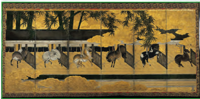
調馬・厩馬図屏風 (Horse and Stable Screen)

約400年前に描かれた、厩 うまや の場面と、屋敷の前で馬を乗り馴らしている場面の2つが組みになった屏風で、国の重要文化財に指定されている。