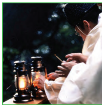
古式により切り出される「浄火」 (Igniting the Fire)