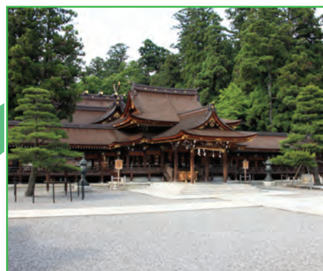
多賀大社 ( Taga Grand Shrine )