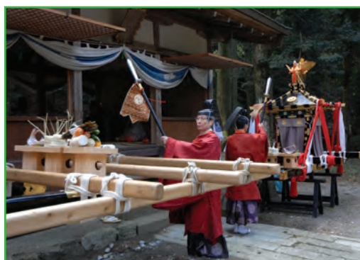
調宮神社神事 (Tonomiya Shrine Ritual)

毎年4月22日に行われる「多賀まつり」は鎌倉時代からの伝統を誇る祭りで、多賀大社最大の祭事である。旧犬上郡（現在犬上郡、彦根市）から毎年祭の主役を司る馬頭人が選出される。1月3日に差定式 さしだめしき で神前で差し定められた馬頭人は全ての祭りの主役となる。最初に本殿祭 みこし が厳かに奉仕され、次に神輿 ほうれん ・鳳輦 ほうねん ・騎馬40数頭を中心とした行列が神社東方4キロ程離れた多賀大社の奥宮 とこのみやじんじや である調宮神社 とこのみやじんじや へ向う。調宮神社で祭典を終えた行列は大社の前にてお祭りの主役である馬頭人と御使殿 おんしでん 等一行と合流し、10万石の大名行列並といわれる列次をつくり、町内 あまご 尼子 うちごめ の「打籠 うちごめ の馬場 ばんば 」へと向う。打籠 うちごめ の馬場 ばんば で「富 とみ の木渡 きわた し」の神事が行われ、行列が神社へお還りになる「本渡 ほんわた り」が行われる。神社へ到着すると引き続き「夕日 ゆふひ の神事」が斎行され、お祭りが終了する。