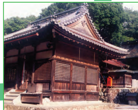
大滝神社 ( Ohtaki Shrine )

多賀町多賀には多賀三社まいりの1つである多賀大社がある。多賀三社まいりとは、多賀町を代表する3つの神社をまわってお参りすることである。第一の神社は近江の古社多賀大社である。第二は巨岩の磐座のある標高333m青龍山のふもとこのみやじんじゃの胡宮神社である。第三は犬上川の奇岩怪石に富む景勝地にある大滝神社である。この3社は、人生に深く関係している縁結びの神、延命長寿の神、子孫繁栄の神（山ノ神）、そして水を司る神様を祀っている。