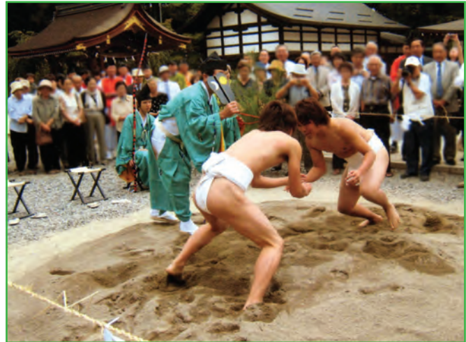
古知古知相撲 (Kochi-kochi Zumo)

毎年 ちょうよう 重陽の節句（9月9日）に行われる由緒ある重儀の1つで、町内より祭りの主役である「 とうにん 頭人」が選出される。境内では「 こちこちずもう 古知古知相撲」が奉納され、頭人を中心として「 うちごめ 打籠の馬場」にお渡りをする。