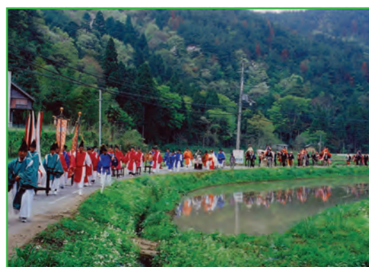
御神幸 (栗栖) (Portable Shrine Carrying)

毎年4月22日に行われる「多賀まつり」は鎌倉時代からの伝統を誇る祭りで、多賀大社最大の祭事である。旧犬上郡（現在犬上郡、彦根市）から毎年祭の主役を司る馬頭人が選出される。1月3日に差定式 さしだめしき で神前で差し定められた馬頭人は全ての祭りの主役となる。最初に本殿祭 みこし が厳かに奉仕され、次に神輿 ほうれん ・鳳輦 ほうねん ・騎馬40数頭を中心とした行列が神社東方4キロ程離れた多賀大社の奥宮 とこのみやじんじや である調宮神社 とこのみやじんじや へ向う。調宮神社で祭典を終えた行列は大社の前にてお祭りの主役である馬頭人と御使殿 おんしでん 等一行と合流し、10万石の大名行列並といわれる列次をつくり、町内 あまご 尼子 うちごめ の「打籠 うちごめ の馬場 ばんば 」へと向う。打籠 うちごめ の馬場 ばんば で「富 とみ の木渡 きわた し」の神事が行われ、行列が神社へお還りになる「本渡 ほんわた り」が行われる。神社へ到着すると引き続き「夕日 ゆふひ の神事」が斎行され、お祭りが終了する。