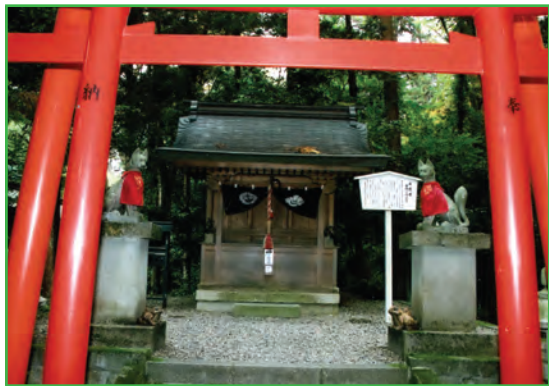
金咲稲荷神社 (Kanesaku-Inari Shrine)

Kanesaku-Inari Shrine is at the end of a row of red torii and red streamer flags along the shrine north path. The patron deity of business prosperity receives many worshippers. Nearby are also enshrined deities for easy childbirth and child-rearing in Koyasu Shrine, Kumano Shrine, Shinmei-Ryougu Shrine, and others. As the Taga Grand Shrine compound contains auxiliary shrine Hyuga Shrine and 14 massha shrines, many worshippers come to obtain benefits from various deities.