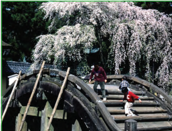
太閤橋 (Taiko Bridge)

正面の大鳥居をくぐったところにある太閤橋(県指定有形文化財)は太閤秀吉(豊臣秀吉; 1537-1598)がおおまんどころ びょうきへいゆ 母大政所の病氣平癒の御礼として奉納した米1万石で奥書院・庭園とともに作られたものである。元は木造であったが、1635年頃に石の橋になった。太閤橋のすぐ左手には学問の神様菅原道真公を祀った天満神社がある。右手には静岡の秋葉神社と京都の愛宕神社の分霊を祀る末社があり、いずれも火伏せの神様である。そのそばにある2本の枝垂れ桜は、縁結びの祭神にちなんで「夫婦桜」と呼ばれている。