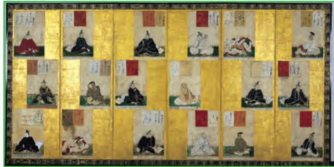
三十六歌仙絵屏風 (36 Immortal Poets Screen)

元々は1人ずつ額になっていたのを屏風の形に貼り合わせたものである。浅井長政 あざいながまさ (1545-1573) の家臣であった遠藤喜右衛門 えんどうき えもん が戦いの勝利を願って、1569年に多賀大社に納めたもので、県の指定文化財である。