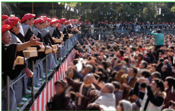
節分祭 (Setsubun Festival)

毎年節分の日に行われる祭礼で、能舞殿前の舞台 かみしもすがた かんれき では県内外から選ばれた300名に及ぶ袴姿の還暦の年男・年女により福豆・福餅まきが行われる。島根 いんばら 県因原地方に伝わる「 おに まい 鬼の舞」が奉納され、福を授かるうとする多くの参詣者で賑わう。