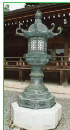
青銅の灯籠 (Bronze Lanterns)

In the center of the temizusha (hand and mouth purification pavilion) is a granite tortoise-shell shaped cistern surrounded by a draining basin. The main shrine buildings are, from the front, the Haiden (worship hall), the Kaguraden ( kagura performance hall), the Heiden (offerings hall), and the Honden (sanctuary). The multi-storied hip-and-gable roofed Haiden was rebuilt in Taisho 4 (1915). Worshippers may receive purification here. Shrine ceremonies are performed in the stone floored Heiden. Supplicants perform prayers and kagura in the Kaguraden, between the Haiden and the Heiden, newly built in the Heisei period. On either side at the front of the Haiden are bronze lanterns dedicated by the 4th Lord of Hikone, Ii Naomori (Naooki). Eleven buildings between the Shinmon and the Honden are Taga Town Designated Tangible Cultural Assets.