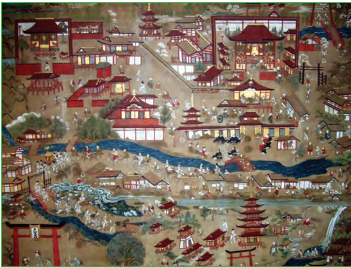
参詣曼荼羅 (Pilgrimage Mandala)

社寺の縁起、ご利益などを絵解き風に描き、参詣と信心を促すために描かれた絵図で、多くは勧進の際に携帯した。安土桃山時代 (1573-1598) のもので、当時の社頭や周辺が克明に描かれ、一方お渡りの様子、能や巫女 みこ の神楽、的場 まとぼ に弓を引く人、馬を引く人、水垢離 みずごり をする人、門前町の賑わいなどが楽しく描かれ、胡宮神社や大滝神社の様子も描かれて、見る人にご利益のありがたさや参詣の意欲をつのらせるものである。