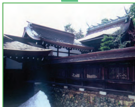
胡宮神社 ( Konomiya Shrine )