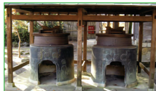
大釜 (Large Pots)

湯神楽 ゆかぐら に使われた大釜は社務所の前に2基据えられている。釜の胴に彫られた陽刻によって1基は寛永15年(1638)、もう1基は元禄12年(1699)の奉納で、元禄のものには徳川幕府 ふしんぶぎょう の普請奉行の名前があることから、造営 しゅんこう の竣功を記念して奉納されたと思われる。